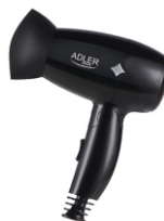
Hair Dryer AD 2251