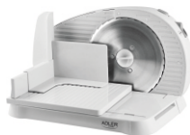
Food Slicer AD 4701