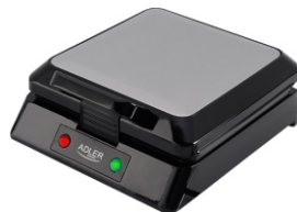
Waffle Maker AD 3036