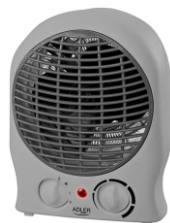
Fan Heater AD 7717