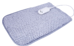
Electric heating pad AD 7415