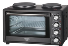
Electric Oven With HOB AD 6020