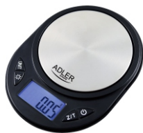
Precision scale AD 3162