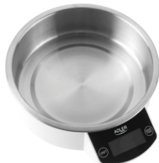
Kitchen Scale AD 8121