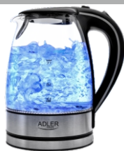
Electric Kettle AD 1225