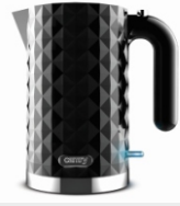
Electric Kettle CR 1169