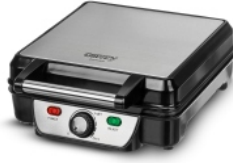
Waffle maker CR 3025