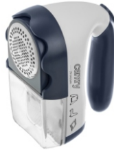
Lint remover CR 9606