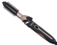
Hair styler set CR 2024