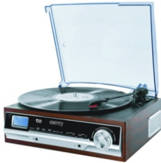
Turntable CR 1113