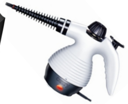
Steam Cleaner CR 7021