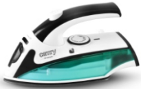
Travel Iron CR 5024