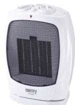
Ceramic Heater CR 7718