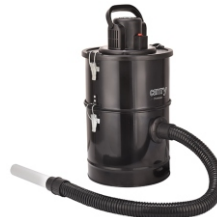
Ash Vacuum 25L 1200W CR 7030