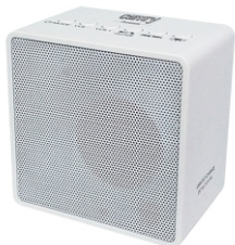
Cube Radio with bluetooth CR 1165