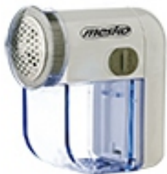
Lint remover MS 9610