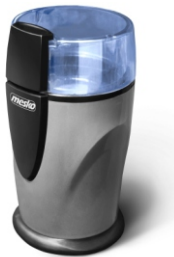
Coffee Grinder MS 4465