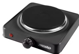
Hot Plate MS 6508