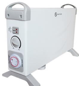
Convector heater MS 7713