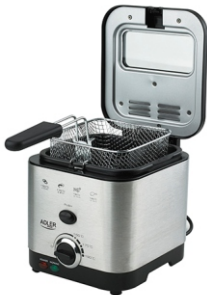
Deep Fryer 1,5L MS 4911