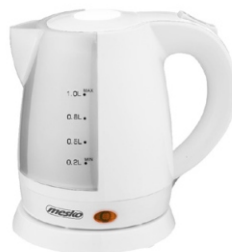
electric kettle MS 1276