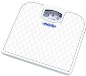
Bathroom scale MS 8160