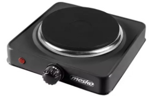
Hot Plate MS 6508