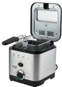
Deep Fryer 1,5L MS 4911