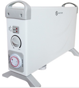
Convecter heater MS 7713