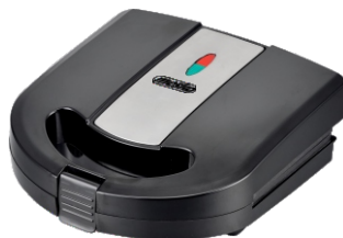
Sandwich Maker MS 3045