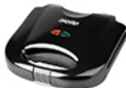
Sandwich Maker MS 3032