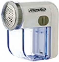
Lint remover MS 9610