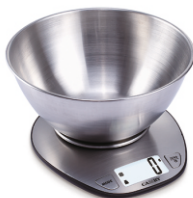
Kitchen Scale MS 3152