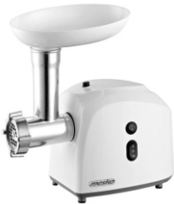
meat grinder MS 4805