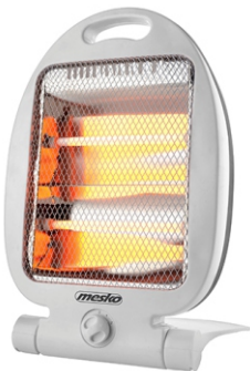
Quartz Heater MS 7710