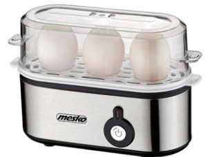
Egg Boiler MS 4485