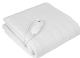
Heating Blanket MS 7419