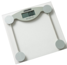
Bathroom Scale MS 8137