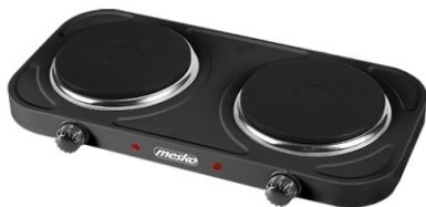
Double hot plate MS 6509