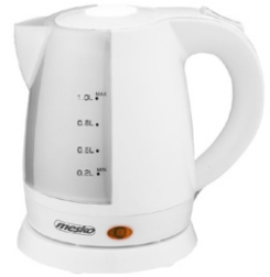
electric kettle MS 1276