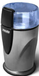
Coffee Grinder MS 4465