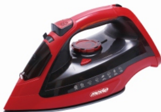
Steam Iron MS 5031