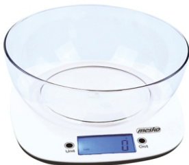
Kitchen scale with bowl MS 3165