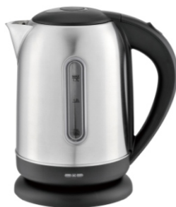
Electric Kettle MS 1288