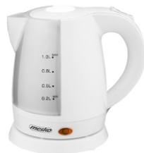
Electric Kettle MS 1276