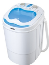
Washing machine MS 8053