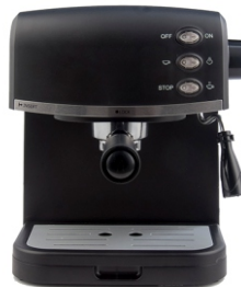
Espresso Maker MS 4409