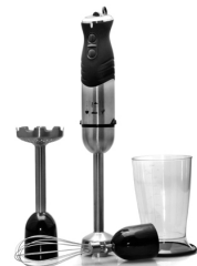
Hand blender CR 4612