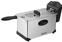
Deep Fryer CR 4909