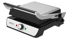
Electric Grill CR 6609