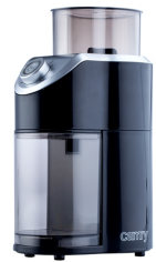
Burr Coffe Grinder CR 4439