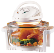
Halogen Oven CR 6305