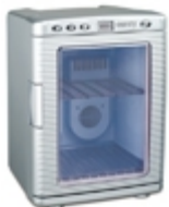
Mini-fridge CR 8062