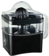
Citrus juicer CR 4001