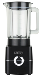
Blender CR 4050