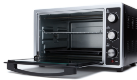
Electric Oven CR 6018