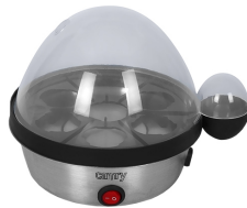
Egg Boiler CR 4482