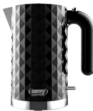
Electric Kettle CR 1269