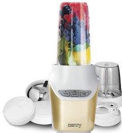
Personal Blender CR 4071