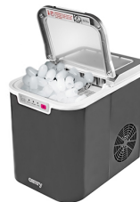
Ice Cube Maker CR 8073