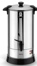
Electric Boiler CR 1267