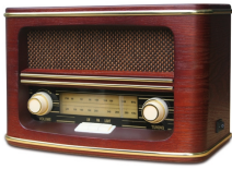
Retro Radio CR 1103